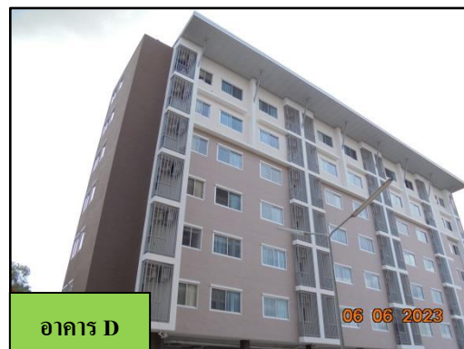
รูปที่ 1-3 ตัวอาคาร