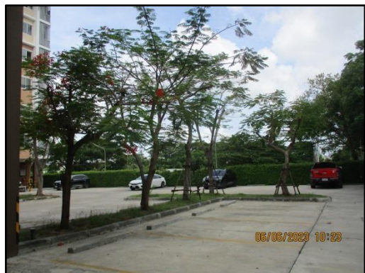
รูปที่ 1-8 พื้นที่สีเขียว