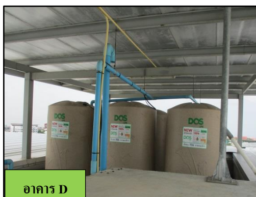
รูปที่ 1-4 ถังเก็บน้ำชั้นดาดฟ้า