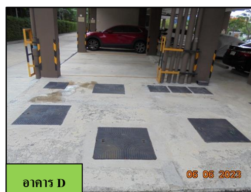
รูปที่ 1-6 ระบบบำบัดน้ำเสีย