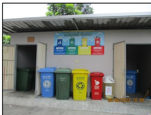
รูปที่ 1-7 ถึงขยะมูลฝอยและห้องพักรวมมูลฝอยภายในโครงการ