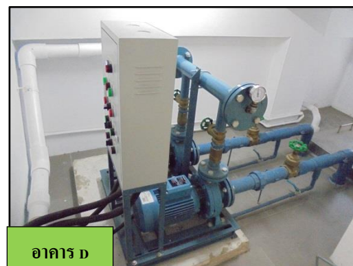
รูปที่ 1-5 ถังเก็บน้ำชั้นใต้ดิน